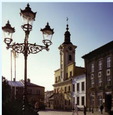
Rynek w Skoczowie

Skoczów – Miasto nad Wisłą. Wzmiankowany w 1232 r. Prawa miejskie w 1267 r. Miejsce urodzenia św. Jana Sarkandra; od 1920 r. (poza okresem wojny) mieszkał tu Gustaw Morcinek. Kościół parafialny (obecny z 1767 r.) p.w. św. Apostołów Piotra i Pawła z cennym wyposażeniem. Zabytkowy rynek z barokową figurą Jonasza (Trytona). Ratusz z 1797 r. Dom św. Jana Sarkandra – muzeum i kaplica „Szpitalik” – kościół szpitalny p.w. Znalezienia Krzyża Świętego z XV w. Kościół ewangelicki p.w. Znalezienia Krzyża z połowy XIX w. (papież spotkał się tu z przedstawicielami społeczności ewangelickiej Śląska Cieszyńskiego). Muzeum Gustawa Morcinka. Pomnik „Poległym za Polskość Śląska”. Pomnik Gustawa Morcinka. Wzgórze Kaplicówka z kaplicą św. Jana Sarkandra i papieskim krzyżem, przeniesionym tu z lotniska na Muchowcu w Katowicach.