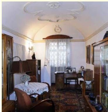
Muzeum Gustawa Morcinka w Skoczowie

Turystyka przyrodnicza i poznawcza to produkt turystyczny, który skierowany jest do klienta indywidualnego i umożliwia zobaczenie bogatej fauny i flory związanej ze środowiskiem nadwodnym, pięknych krajobrazów z malowniczymi kapliczkami i krzyżami przydrożnymi, galerii oraz zabytkowych obiektów dworskich i łowieckich, znajdujących się na terenie gmin: Strumień, Chybie i Jasienica. Posiada on charakter dwudniowej wycieczki rowerowej o niewielkiej skali trudności. Zarówno program, jak i formę poznawania opisanych w ofercie atrakcji można dostosować indywidualnie do własnych potrzeb i zwiedzać je, korzystając z tworzącego produkt fragmentu „Szłaku Myśliwstwa”, „Szłaku Starówek”, czy „Szłaku Piastów i Habsburgów” zwanego „Drogą Książęcą - Via Ducalis”.