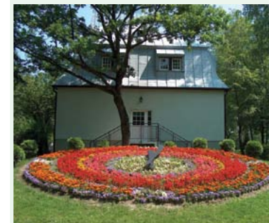
Kwietnik w parku zdrojowym

Początek szlaku to dworzec autobusowy w Jastrzębiu-Zdroju. Stąd kierujemy się ul. Warszawską do przejazdu kolejowego, a następnie