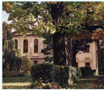
Zespół pałacowo-parkowy w Jaworzu

Marklowice – Nadgraniczna wieś nad Olzą, włączona w 1977 r. do Cieszyna. Budynek folwarczny z XVII w. Fabryka farb i lakierów „Polifarb” zbudowana w latach 1962–68.