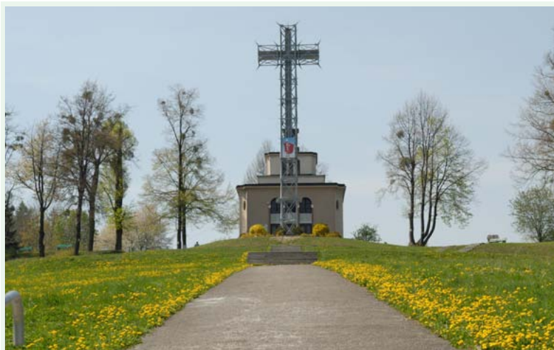
Wzgórze Kaplicówka w Skoczowie