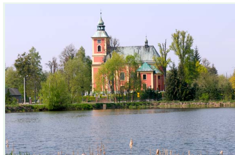
Kościół Narodzenia NMP w Kończycach Małych

willowych, basen kąpielowy. Docieramy do Jaworza Nałęża. Tu spotykamy Euroregionalną Trasę Rowerową Nr 122 C i ul. Cisową kierujemy się do Jasienicy mijając po drodze dolinę potoku Jasienica. Ulicą Cisową kierujemy się do Jasienicy mijając po drodze dolinę potoku Jasienica. Dojeżdżamy do granicy z gminą Brenna. Tereny leśne, docieramy do wsi Górki Wielkie. Droga wije się wśród zagród, podziwiamy widoki śródgórskie. Znajdujemy się w Dolinie Wschodnicy. Dalej mijamy mostek na Brennicy oraz początek trasy Nr 123 S, my kierujemy się do Zalesia. Droga biegnie wśród lasów i pól. Za sobą mamy Górki Wielkie, Krzywianiec, Zalesie i Na Stawie. Przed nami gmina Ustroń. Przekraczamy rzekę Wisłę. Spotykamy trasę Nr 24 C a następnie Punkt Odpoczynkowy nad Wisłą. Po odpoczynku kierujemy się w stronę Nierodzimia. Jedziemy wałem przeciwpowodziowym wzdłuż Wisły do ul. Krzywianiec, do mostu w Lipowcu. Ulicą Wałową docieramy do Mostu Kuźniczego. Przejeżdżamy mostem na drugą stronę rzeki i ul. Sportową wspólnie z trasą Nr 24 C przejeżdżamy obok zakładów prze-