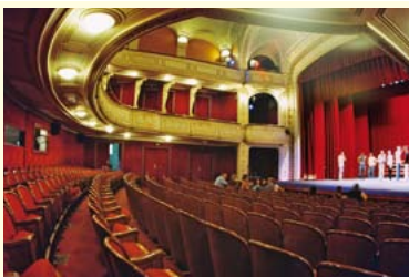
Wnętrze Teatru w Cieszynie, fot. J. Szczotka