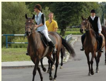
Jeździecki Klub Sportowy „Czanki” w Międzyrzeczku Górnym

Po południu warto udać się do leżącego między rzekami Jasienicą, Rudawką, Międzyrzeczką i Wapienicą Międzyrzecz Górny, by zwiedzić kościół ewangelicko - augsburski z II poł. XIX w. We wnętrzu świątyni na uwagę zasługują ołtarz główny z obrazem przedstawiającym Ostatnią Wieczerzę, ambona oraz chrzcielnica z pokrywą w kształcie odwróconego kielicha. Innym ciekawym obiektem Międzyrzeczka jest Izba Regionalna, w której zgromadzono stare formy do produkcji masła, żelazka, latarnie, maszyny do szycia, prasy do owoców, piękne serwety z wyhaftowanymi przysłowiami, kancjonały, czy banknoty. Dla aktywnych dużą atrakcją będzie z pewnością Jeździecki Klub Sportowy „Czanki”, posiadający krynę ujeżdżalnię oraz otwarty plac do jazdy konnej.