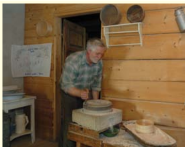
Chlebowa chata Dudysów w Górkach Małych