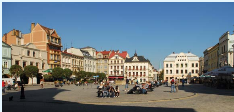
Rynek w Cieszynie, fot. J. Szczotka

Brenna – Miejscowość letniskowa położona w górnym biegu Brennicy i jej dopływów (m. in. Leśnicy, Hołcyny i Jatnego). Początki miejscowości sięgają roku 1490. W czasie okupacji hitlerowskiej wieś stanowiła silny ośrodek działalności partyzantki polskiej i radzieckiej. Ośrodek żywej tradycji sztuki ludowej i folkloru. Kościół parafialny p.w. św. Jana Chrzciciela z 1796 r. (przebudowany w 1929 r.). Liczne przydrożne kapliczki. Drewniane chałupy z XIX–XX w., kryte słomą lub gontami. Czynne szałas pasterskie na pobliskich halach.