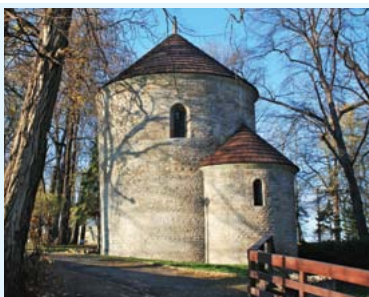
Rotunda rromańska w Cieszynie

stawów rybnych. Pierwsza wzmianka w 1305 r. W sąsiedztwie eksploatacja gazu ziemnego i solanek jodo-bromowych. Ośmioboczny spichlerz z XVII w. Dawna gorzelnia z XIX w. Kościół p.w. św. Mateusza z 1885 r. (Ogrodzona). Fontanna solankowa w centrum Dębowa.