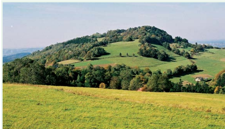
Rezerwat „Góra Tuł” w Lesznej Górze, fot. T. Jaszowski

jest umiejscowiony punkt odpoczynkowy. Nasz szlak Nr 255 Y kieruje się pomiędzy staw a brzeg rzeki Piotrówki, przekraczamy rzekę po kładce nad nią i wzdłuż potoku Kaczok oraz boiska sportowego dojeżdżamy do drogi wojewódzkiej Nr 937. Po jej przekroczeniu ulicami: Jagiellońską, Zagrodową, Świtezianki docieramy do ul. Jodłowej. Ten odcinek jest widokowy. Jesteśmy na ul. Jana Matejki, a następnie na ul. Średnicowej z zabudową wiejską. Mijamy zakład bruckarski i cmentarz w Kaczacach Dolnych. Ul. Lipowa, kolejny punkt węzła szlaków Nr 255 Y, 24 C i 124 N. Mijamy zabytkowy drewniany kościółek i osiągamy centrum Kaczyc w sąsiedztwie Domu Ludowego, poczty, przedszkola i szkoły. Stąd ulicami Harcerską, Poczтовую, Małą i Sobieskiego zamykamy pętlę tandemową Nr 255 Y.