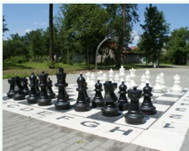
Szachy w strumieńskim parku