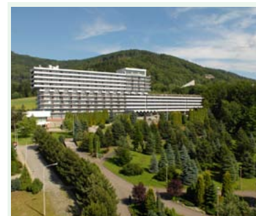
Uzdrowisko w Ustroniu

Początek szlaku na parking w Parku Zdrojowym w Jaworzu, skąd ul. Wapiennicką, południową i Podgóorską dojeżdżamy do ul. Panoramicznej i Turystycznej. Mijamy hotel „Jawor”, kierujemy się do Jaworza Górnego. Mijamy zespół domów