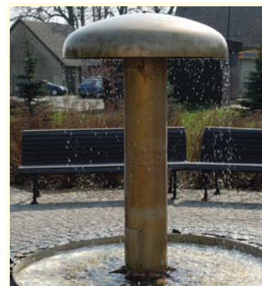
Fontanna solankowa w Dębowcu

W pierwszym dniu wycieczki odwiedzimy Dębowiec - gminną wieś położoną w dolinie Knajki wśród stawów rybnych i pól uprawnych. Warto w niej zobaczyć kościół rzymskokatolicki św. Małgorzaty z II poł. XIX w. oraz pozostałości zabudowań folwarcznych. Rozciągające się wzdłuż rzeki Knajki Stawy Dębowieckie: Górniok, Zamkowy, Morskie Oko, stanowią ostoję i łęgowisko dla ptactwa wodnego. Ze stawami wiąże się ponadto długa historia hodowli ryb na tym terenie, czego przykładem jest znajdująca się w miejscowości Przetwornia Ryb, prowadząca wylęg i sprzedaż wielu gatunków ryb słodkowodnych. Jednak największą atrakcją turystyczną Dębowca są bogate i unikatowe na skalę światową złoża solankowe. Warto z nich skorzystać na miejscu dzięki wybudowanej w celach leczniczych fontannie solankowej, umożliwiającej naturalną inhalację dróg oddechowych lub zaopatrzyć się w różne rodzaje solanki i soli w Kopalni i Warzelni Solanek dr Zabłocka Sp. z o.o.