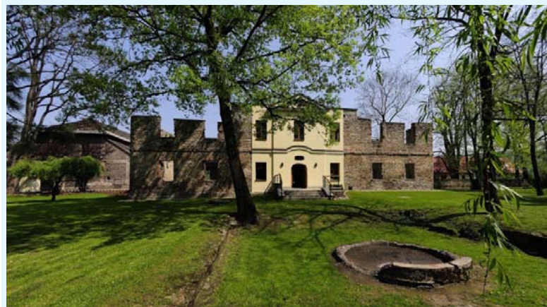
Dwór Kossaków w Górkach Wielkich

Chałupki – Przejście graniczne z Republiką Czeską (na rzece Odrze). Pierwsza pisemna wzmianka o miejscowości pochodzi z 1383 r. Zamek z 1682 r. przebudowany na przełomie XVIII i XIX w. Obok znajdują się ślady bastionowych fortyfikacji i park pałacowy z pomnikowymi lipami i kasztanowcami. Aleja jesionowa. Neogotycki dworzec i zabudowania stacyjne z 2 połowy XIX w.