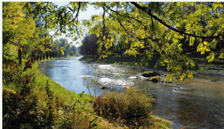
Rzeka Olza

Łącznikowy szlak, skrzyżowanie dróg w dolinie Czadeczki z Jaworzynki – Duraje i z Zapasie-