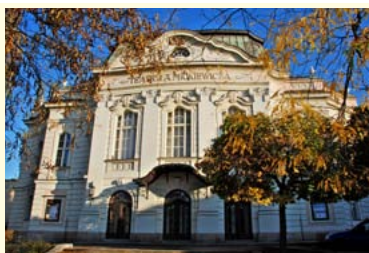
Teatr im. Adama Mickiewicza w Cieszynie

Agroturystyka i turystyka miejska to produkt turystyczny, który skierowany jest do klienta indywidualnego i umożliwia poznanie najciekawszych miejsc związanych z bogactwem tradycji, kultury, zabytków i przyrody znajdujących się na terenie Cieszyna, Skoczowa oraz gmin: Golezów i Dębowiec. Został on podzielony na dwie dwudniowe oferty spędzenia wolnego czasu. Zarówno programy, jak i formę poznawania opisanych w nich atrakcji można dostosować do własnych potrzeb i zwiedzać je, korzystając z tworzącego produkt fragmentu „Szłaku Tradycyjnego Rzemiosła”, „Szłaku Starówek”, „Szłaku Piastów i Habsburgów” zwanego „Drogą Książęcą - Via Ducałlis”, czy „Szłaku Papieskiego w Beskidzie Śląskim”.