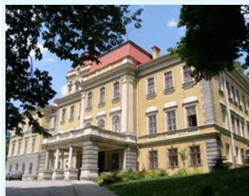
Pałac w Kończykach Wielkich

Łaziska – Wieś nad Olzą. Kościółek drewniany z 1579 r. z elementami gotyku. Niedawno odkryta polichromia pozwala datować kościół na około 50 lat wcześniej. Kamienny krzyż pokutny. Pomnikowe dęby.