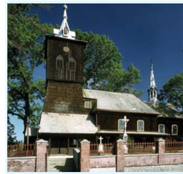
Kościół św. Anny w Gólkowicach

Górk Wielkie – Wieś nad Brennicą, znana już w 1305 r. jako Górk. Górk Wielkie po raz pierwszy pojawiają się w 1521 r.; ośrodek turystyczno-wypoczynkowy. Gotycki kościół p.w. Wszystkich Świętych fundacji Góreckich z XV w. (przebudowany w 1662 r.), obok cmentarz, gdzie spoczywa Zofia Kossak-Szczucka. Nowoczesny kościół ewangelicko-augsburski p.w. Apostoła Jana (przysiółek Pinkas). Muzeum biograficzne Z. Kossak-Szczuckiej w domku ogrodnika (pisarka pochowana na miejscowym cmentarzu. Aleja dębowo-lipowa. W Górkach Małych - Chlebowa Chata.