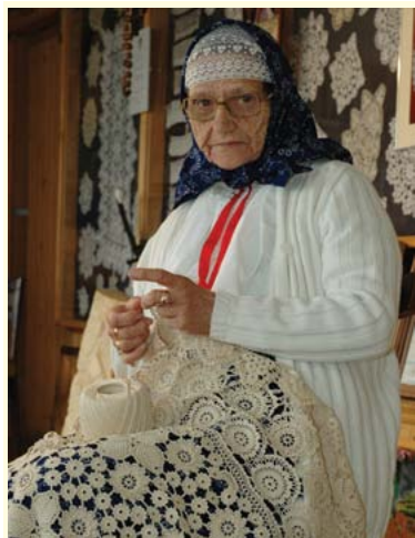
Izba twórcza rzeźby i koronki ludowej Kamieniarzów w Koniakowie