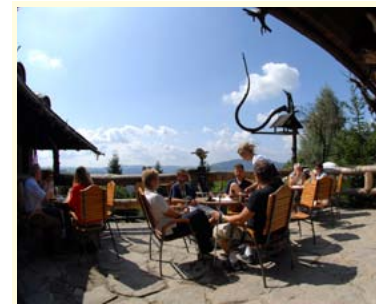
Zbójnicka chata na Równicy, fot. J. Szczotka