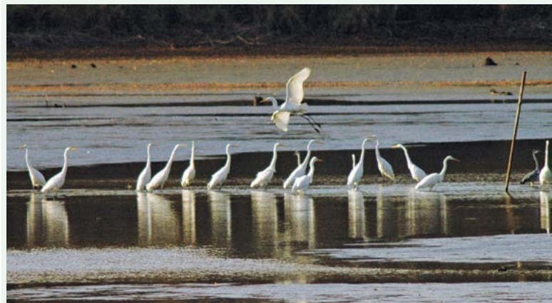
Pactwo wodne Jeziora Goczałkowickiego w Zarczewu

Szlak ten oznakowany jest emblematami rowerowymi i logo (trzy drzewka koloru niebieskiego). Jest możliwość zdobycia odznaki.