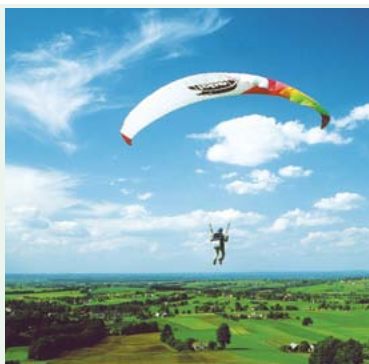
Szkolenia paralotniowe na górze Chetm