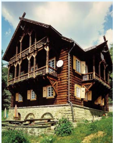
Dworek myśliwski „Konczakówka” w Brennie

Dębowiec – Malownicza miejscowość położona w dolinie Knajki, w otoczeniu licznych