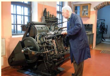
Muzeum drukarstwa w Cieszynie

„Szlak Tradycyjnego Rzemiosła” łączy miejsca, w których rodzimi twórcy nadal pielęgnują tradycyjne zawody, takie jak: bibułkarstwo, koronczarstwo, haft, jubilerstwo, kowalstwo, piernikarstwo, rymarstwo i wiele innych. Na terenie polskiej strony Euroregionu Śląsk Cieszyński szlak przebiega przez Jaworzynkę, Istebną,