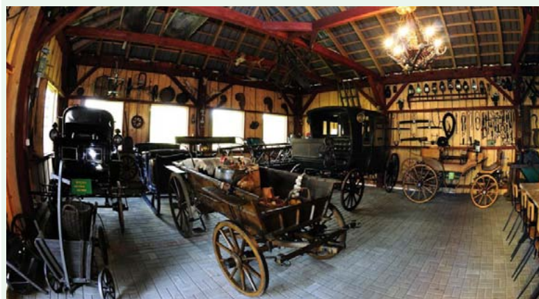
Powozownia Andrzeja Lacela w Puńcówce

kręcie w Dziegiełowie kierujemy się w prawo - do Cisownicy, przystanku autobusowego Hławiczka. Krajobraz zmienny, pofalowany, widokowy. Cisownicę przejeżdżamy obok kościoła dojeżdżamy do sklepu i świetlicy gminnej. Z centrum Cisownicy obok remizy OSP kierujemy się do szkoły przy potoku Rzeczycza. Trasa staje się trudna, liczne zakręty, systematycznie pod górę, za nawierzchnia drogi. Dojeżdżamy do polany na Małej Czantorii, do punktu odpoczynkowego. Z polany kierujemy się w stronę Ustronia, po drodze podziwiamy dolinę Wisły i masyw Równicy. Mijamy zakłady wód mineralnych „Ustronianka”, ośrodek kempingowy oraz rozlewnię wód mineralnych „Czantoria”. Ulicami Jelenia, Partyzantów 3-go Maja, Hutniczą docieramy do centrum Ustronia. Tutaj znajdują się Muzeum Hutnictwa, restauracja „Ustroń” a za nią park. Mijamy przejazd kolejowy i ul. Parkową, spotykamy szlaki Nr 13 Z oraz 24 C. Ul. Legionów dojeżdżamy do Zawodzia. W tej parkowo-rekreacyjnej części Ustronia kończy się szlak Nr 13 Z.