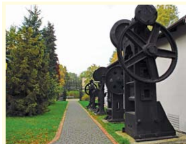
Muzeum Ustrońskie

Naszą wycieczkę rozpoczynamy w Ustroniu - mieście położonym w dolinie rzeki Wisły, na północnym skraju Beskidu Śląskiego. Ten jedyny wczasowo - uzdrowiskowy ośrodek w tej części regionu oferuje turystom szereg atrakcji. Wśród zabytków architektury znajdujących się w centrum Ustronia na uwa-