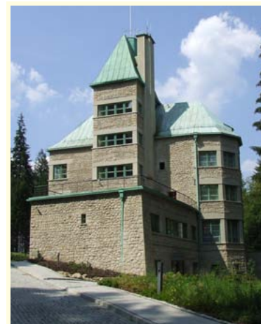
Zameczek Prezydenta RP na Zadnim Groniu