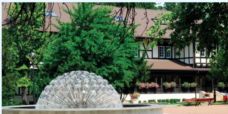
Dom Zdrojowy w Jastrzębiu-Zdroju

Iłownica – Wieś położona nad kompleksem stawów (pamiętających czasy piastowskie), zagospodarowanych przez PAN (hodowla ryb i ptactwa wodnego), w dolinie Iłownicy. Pierwsza wzmianka w 1305 r. Dwór Baszyńskich z 1690 r. Pozostałość parku o charakterze tarasowym.