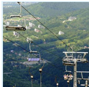
Czantoria w Ustroniu

Ustroń – Miasto nad Wisłą, u podnóża Beskidu Śląskiego – pierwsza wzmianka z 1305 r. Od II połowy XVIII w. ośrodek hutniczy, od 1882 r. uzdrowisko. Prawa miejskie w 1956 r. Budynek dawnej administracji huty obecnie Muzeum Miejskie - Kuźnictwa i Hutnictwa. Dawne budynki huty i miniskansen maszyn. Muzeum Regionalne „Stara Zagroda”, rekonstrukcja drewnianej zabudowy z II połowy XIX w. Pomnik ofiar II wojny światowej. Pomnik pilota Jana Cholewy. Muzeum ze zbiorami starodruków. Drewniany kościółek p. w. św. Anny z 1769 r. (Nierodzim). Kościół katolicki p.w. św. Klemensa, z 1788 r. i stary cmentarz. Klasycystyczny Kościół ewangelicki p. w. Apostoła Jakuba z 1835 r. Dąb Sobieskiego z 1683 r., zasadzony na pamiątkę przemarszu oddziałów króla Jana III Sobieskiego pod Wiedeń. Dzielnica uzdrowska Zawodzie. Bulwary spacerowe nad Wisłą. Zagospodarowane licznymi atrakcjami turystycznymi zbcza Równicy i Wielkiej Czantorii.