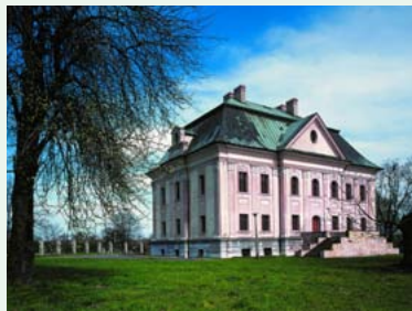
Pałac w Jastrzębiu Boryni, fot. arch. UM Jastrzębie-Zdrój

Markłowice Górne – Ruptawa – Jastrzębie-Zdrój Z Markłowic Górnych ruszamy w kierunku Jastrzębia-Zdroju, z lewej strony dołączy do nas trasa nr 126 Y, która po 400 m równoległej jazdy skręci w lewo. Przez dzielnicę miasta Ruptawa dojedziemy do Jastrzębia-Zdroju, gdzie z lewej strony znowu dochodzi trasa nr 126 Y, która dalej biegnie wspólnie z naszą trasą. Po prawej stronie czeka na nas miejsce odpoczynkowe „OWN”, jedziemy dalej do miasta, gdzie z prawej strony dołączy trasa nr 9 N biegnąca krótki odcinek wspólnie z naszą trasą, a w międzyczasie żegnamy się z trasą nr 126 Y.