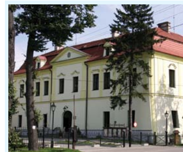
Zamek w Zebrzydowicach

Zebrzydowice – Duża wieś nad Piotrkówką (wzmiankowana w 1305 r.), związana z losami Księstwa Cieszyńskiego. Kościół p.w. Wniebowstąpienia N.M.P. z drugiej połowy XVIII w., z zachowanymi epitafiami. Cmentarz z grobem poległych w wojnie polsko-czechosłowackiej oraz ks. Antoniego Janusza – autora polskiego „Kancjonału”. Pałac barokowy zwany „zamkiem”, zbudowany w XVI w. jako „twierdza”, gruntownie przebudowany w 1760 r. Pomnikowe drzewa. Kapliczki i krzyże przydrożne. Szkolne Muzeum (historia i etnografia). Pomnik pomordowanych Żydów z podboju KL Auschwitz. Graniczne przejście kolejowe. Ośrodek sportów wodnych „Młynszczyk”.