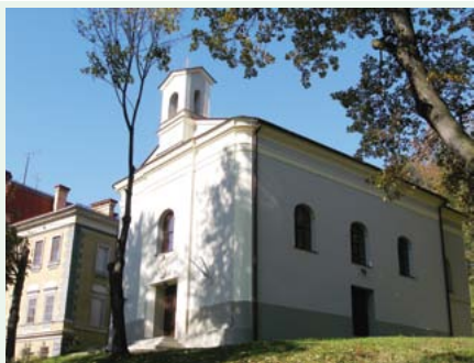
Kaplica Opatrzności Bożej w Kończycach Wielkich

doliną Jastrzębianki do Jastrzębia Górnego. Za zabytkowym kościołem kierujemy się do ul. Pszczyńskiej którą przejeżdżamy, następnie ul. K. Wierzyńskiego, K.J. Gałczyńskiego docieramy do dzielnicy Pochwacie – najwyższej położonej części Jastrzębia-Zdroju. Tu jedziemy ul. Okopową, Długą, Szybową. Po drodze mijamy szyb V KWK „Jaś-Mos”, kapliczkę przy której skręcamy w ul. Ks. H. Bednorza. Po lewej stronie pozostaje os. „Przyjaźń” a po prawej mijamy zabytkowy drewniany kościółek. Ul. Górnica i Bogoczowiec docieramy na Bożą Górę, miejsca pamiętającego kampanię wrześniową 1939 r., walki o wyzwolenie w 1945 r., skąd udajemy się w kierunku osiedla Boża Góra Prawa. Ul. Witczaka mijamy wiadukt kolejowy (byłej trasy kolejowej Jastrzębie-Zdrój – Wodzisław Śląski), potok Jastrzębianka oraz basen kąpielowy. Teraz podjazd przez Park Zdrojowy, dalej ul. Witczaka mijamy pomnik martyrologii, zabytkową zabudowę dawnego sanatorium, budynki klasztorne i kościół parafialny. Jesteśmy w centrum dzielnicy Zdrój. Za postojem także możemy spotykać szlak Nr 24 C który towarzyszy nam do ul. W. Jagieli. Następnie ul. T. Kościuszki dojeżdżamy do dworca autobusowego. Kierujemy się w prawo ul. Broniewskiego i Al. Jana Pawła II dojeżdżamy do hotelu „Diament”, skąd ul. J. Kusocińskiego zjeżdżamy w dół do ul. Jagieli, mijając PSP na os. Chrobrego. Tu opuszczamy