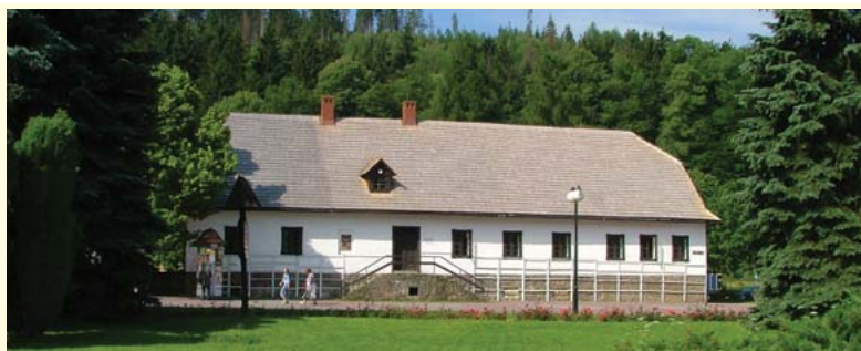
Muzeum Beskidzkie im. Andrzeja Podzorskiego w Wiśle

scenę Chrztu Chrystusa w Jordanie, ambona z XIX w. oraz rzeźby św. Józefa z Dzieciątkiem i św. Anny z Matką Bożą. Wspaniały zabytek Brennej stanowi dworek myśliwski „Konczakówka” z I poł. XX w. Zbudowany w stylu tyrolskim obiekt, krywa w swoim wnętrzu wiele trofeów myśliwskich, oszczepów na niedźwiedzie, rysunków i obrazów przedstawiających sceny o tematyce łowieckiej. Obok dworku stoi kapliczka św. Huberta z ciekawym witrażem przedstawiającym wizerunek jej patrona. W miejscowości zachowało się ponadto kilkanaście zabytkowych chat górskich z XVIII i XIX w. Jedną z nich przeznaczono na Izbę Regionalną. Na koniec pobytu w Brennej można udać się do dzielnicy Hołcyn, w której znajduje się przystań wodna. Powstała ona w 1962 r. i służyła początkowo jako zapora przeciwpowodziowa, a dzisiaj jest doskonałym miejscem do uprawiania różnych form sportu i rekreacji. Tutaj dobiega końca nasza interesująca podróż.