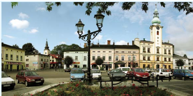
Rynek w Strumieniu