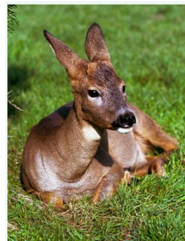
Zwierzyna płowa na łąkach myszkowskich w Zabłociu, fot. J. Szczotka