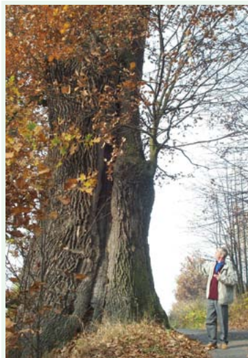
Stary dąb (Mieszko) w Kończycach Wielkich

Trasa tandemowa rozpoczyna się w Kaczacach Górnych, skąd ul. Sobieskiego i Magnolii, pomiędzy posesjami, ul. Otrębrowską i Olchową dojeżdżamy do budynków po byłej kopalni „Morcinek”. Kierujemy się do ul. Morcinka i os. Morcinka. Tu po minięciu skrzyżowania kierujemy się w ulicę M. Konopnickiej, następnie w ul. Słoneczną. Za stacją benzynową wjeżdżamy w wąską drogę szutrową, ul. Słoneczną i Podlesie wspólnie ze szlakami Nr 24 C, 124 N i 255 Y kierujemy się na pobliski most kolejowy linii Zebrzydowice – Cieszyn, następnie do punktu odpoczynkowego. Po odpoczynku leśną drogą docieramy do węzła szlaków rowerowych, gdzie odchodzi szlak 124 N a pozostałe kierują się duktem leśnym do gminy Hażlach. Docieramy do Brzeźówki, gdzie odchodzi szlak Nr 24 C, a my dalej - ul. Leśną, mijamy pola uprawne i stawy, rzadko gospodarstwa rolne. Ul. Zniwna, tereny rolnicze po obu jej stronach. Szlak kieruje się w ul. Jastrzębską, a następnie ul. Statek, droga jest coraz gorsza, dojeżdżamy do brodu na potoku. Jesteśmy w dolinie Wschodnicy. Jedziemy brzegiem lasu aż do drogi Kończyce Wielkie – Hażlach. Spotykamy tu subtrasę Nr 13 Z, mijamy kapliczkę, gospodę i remizę OSP, spotykamy trasę Nr 124 N, podążamy ul. Kościelną mijając boisko sportowe, drewniany kościółek i kierujemy się w stronę zamku w Kończycach Wielkich. Stąd ulicami Górna, Dolna i Bławatkową docieramy do ośrodka „Vena” i zamku w Kończycach Małych, gdzie