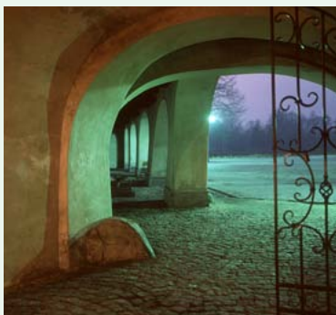
Zamek w Kończycach Małych

doliną Jastrzębianki do Jastrzębia Górnego. Za zabytkowym kościołem kierujemy się do ul. Pszczyńskiej którą przejeżdżamy, następnie ul. K. Wierzyńskiego, K.J. Gałczyńskiego docieramy do dzielnicy Pochwacie – najwyższej położonej części Jastrzębia-Zdroju. Tu jedziemy ul. Okopową, Długą, Szybową. Po drodze mijamy szyb V KWK „Jaś-Mos”, kapliczkę przy której skręcamy w ul. Ks. H. Bednorza. Po lewej stronie pozostaje os. „Przyjaźń” a po prawej mijamy zabytkowy drewniany kościółek. Ul. Górnica i Bogoczowiec docieramy na Bożą Górę, miejsca pamiętającego kampanię wrześniową 1939 r., walki o wyzwolenie w 1945 r., skąd udajemy się w kierunku osiedla Boża Góra Prawa. Ul. Witczaka mijamy wiadukt kolejowy (byłej trasy kolejowej Jastrzębie-Zdrój – Wodzisław Śląski), potok Jastrzębianka oraz basen kąpielowy. Teraz podjazd przez Park Zdrojowy, dalej ul. Witczaka mijamy pomnik martyrologii, zabytkową zabudowę dawnego sanatorium, budynki klasztorne i kościół parafialny. Jesteśmy w centrum dzielnicy Zdrój. Za postojem także możemy spotykać szlak Nr 24 C który towarzyszy nam do ul. W. Jagieli. Następnie ul. T. Kościuszki dojeżdżamy do dworca autobusowego. Kierujemy się w prawo ul. Broniewskiego i Al. Jana Pawła II dojeżdżamy do hotelu „Diament”, skąd ul. J. Kusocińskiego zjeżdżamy w dół do ul. Jagieli, mijając PSP na os. Chrobrego. Tu opuszczamy