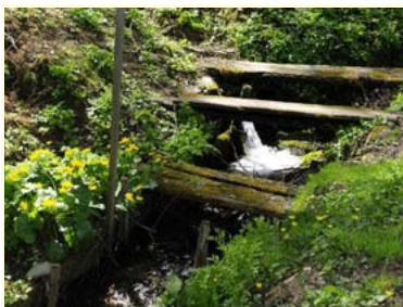
Czynne źródła tufove w Ogrodzonej

Turystyka krajoznawcza to produkt turystyczny, który skierowany jest do klienta indywidualnego i umożliwia poznanie siedzib dawnych rodów ziemian, zabytkowych kościołów i krzyży przydrożnych oraz wielu osobliwości natury, znajdujących się na terenie Jastrzębia Zdroju oraz gmin: Hażlach, Zebrzydowice i Godów. Posiada on charakter jednodniowej wycieczki rowerowej o niewielkiej trudności. Zarówno program, jak i formę poznawania opisanych w ofercie atrakcji można dostosować indywidualnie do własnych potrzeb i zwiedzać je, korzystając z tworzącego produkt fragmentu „Szłaku Tradycyjnego Rzemiosła”, „Szłaku Architektury Drewnianej”, czy „Szłaku Piastów i Habsburgów” zwanego „Drogą Książęcą - Via Ducalis”.