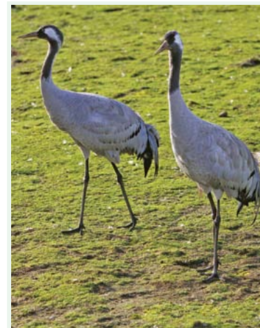
Żurawie w rezerwacie „Rotuz”

Szlak rowerowy o charakterze i przebiegu międzynarodowym przez Austrię, Republikę Czeską (Morawy) i Polskę. Idea szlaku jest skierowanie turysty rowerowego zielonymi terenami, przyjaznymi dla krajoznawców. W obszarze Euroregionu Śląsk Cieszyński szlak rozpoczyna się na Moście Przyjaźni w Cieszynie, następnie przebiega przez Puńców, Dziegiełłów, Goleszów. Dalej przez obszar gminy Skoczów do wału Wisły i po nim do Ustronia-Nierodzimia, gdzie przekracza rzekę po kładce i podąża przez Górki Wielkie (gmina Brenna) do Jaworza-Nałęża a następnie Jaworza-Sredniego, gdzie opuszcza na odcinku 14 km Euroregion Śląsk Cieszyński, podążając przez obszar miasta Bielsko-Biała (Wapienka, Stare Bielsko). W Mazańcowicach (gmina Jasienica) KMW Greenways wraca do Euroregionu przebiegając przez Międzyrzecze, Rudzicę i Landek do granicy gminy przy rezerwacie Rotuz, przy którym wkracza do miasta Czechowice-Dziedzice.