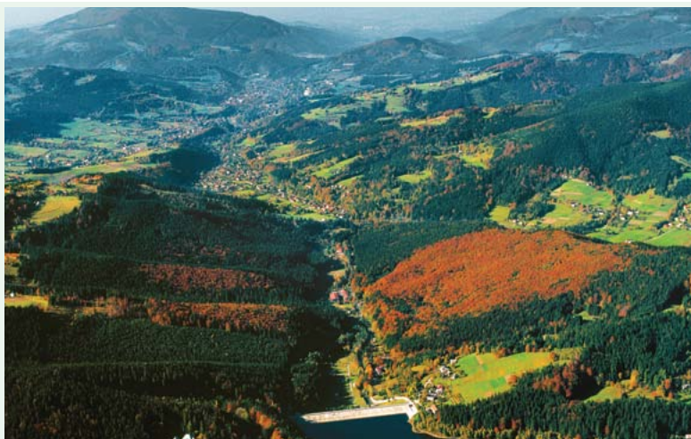
Jezioro Czernańskie w Wiśle Czarnem

Trasa nr 6086: Vendryń – Nýdek – Gruniček-sedlo – (zobacz wycinek mapy nr 4) schronisko Bahenec – Písek – połączenie z trasą nr 6080 Trasa nr 6087: Bystřice – Nýdek (szlak łączący trasy nr 6085 i 6086)