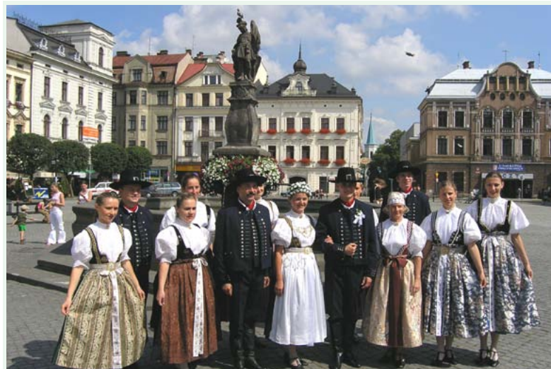
Zespół Pieśni i Tańca Ziemi Cieszyńskiej na rynku w Cieszynie

przy której jest punkt odpoczynkowy. Nieopodal na skrzyżowaniu ulic Lipowej, Cieszyńskiej i Spacerowej spotykamy trasy rowerowe Nr 24 C, Nr 13 Z oraz Kraków-Morawy-Wiedeń Greenways a następnie trasę Nr 256 N i podążamy drogą określoną przez mieszkańców nazwą „Droga Przez Wieś”, która biegnie wzdłuż Puńcówki w zwartej zabudowie wiejskiej. Mijamy sklep spożywczy, bar „Franio”, zakład drzewny, zamek w Dzięgielowie. Tutaj odchodzi trasa Nr 256 Y do Lesznej Górnej. Nasza trasa wzdłuż fasady zamku kieruje się w kompleksy leśne, są liczne podjazdy i tak dojeżdżamy do sołectwa Cisownica. Za przystankiem autobusowym skręcamy w prawo na nowo wybudowaną kładkę nad potokiem Łubieńskim i dojeżdżamy do przysiółka Wądoły. Trawersujemy zbocze Goloźnia, następnie mijamy przysiółek Pazuchy, gdzie znajduje się najwyższy punkt topograficzny na obwodnicy gole-