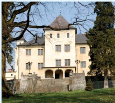
Zamek w Grodźcu Śląskim