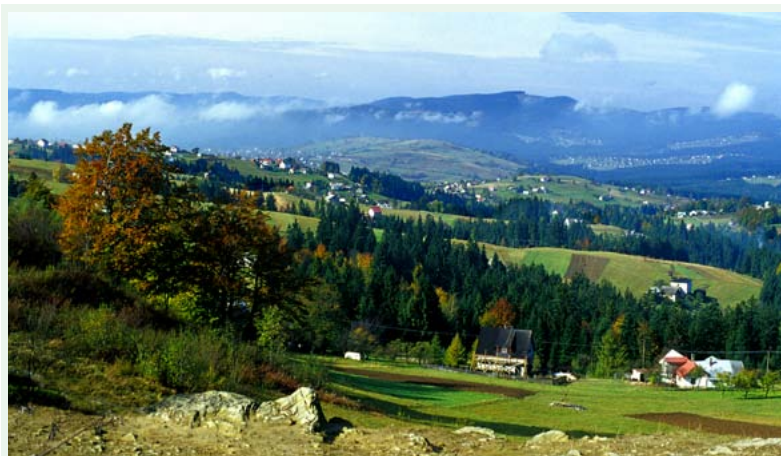
Panorama Koniakowa

tereny otwarte i bardzo widokowe. Mijamy wyciągi narciarskie oś. Legiery w Koniakowie, gdzie można odwiedzić Muzeum Koronki. My kierujemy się drogą wojewódzką Nr 943 na przełęcz Koniakowską. Przejeżdżamy siodłem między Ochodzitą a Koczym Zamkiem i obok restauracji „Koronka” do punktu odpoczynkowego. Stąd strome zjazdy i zakręty w dolinę Roztoki, przecinamy potoki po kładkach, mijamy Uczniowski Ośrodek Wypoczynkowy przy szkole podstawowej. Kierujemy się w stronę rzeki Olzy, którą przekraczamy po moście, mijamy zajazd „Nad Olzą” i udajemy się do miejsca odpoczynkowego w sąsiedztwie schroniska PTSM „Zaolzianka”. Spotykamy tu szlak Nr 24 C. Tu nasz szlak się kończy.