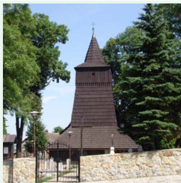
Kościół św. Rocha w Zamarskach, fot. G. Kasztura

mysłowych i obiektów rekreacyjno-sportowych kierujemy się w stronę Ustronia (Uzdrowiska). Z ul. Sportowej ulicą Grażyńskiego, Al. Legionów, wzdłuż Wisły ul. Parkową docieramy do Zawodzia – węzeł Euroregionalnych Tras Rowerowych Nr 13 Z i Nr 24 C. Kierujemy się w stronę Parku im. Kościuszki, gdzie kończy się szlak Nr 12 N.