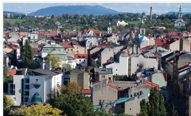
Panorama Cieszyna z Wieży Piastowskiej

Po zwiedzeniu Cieszyna jedziemy dalej przez Marklowice oraz przez miejscowości gminy Hażlach – Pogwizdów i Brzezówkę i dojeżdżamy