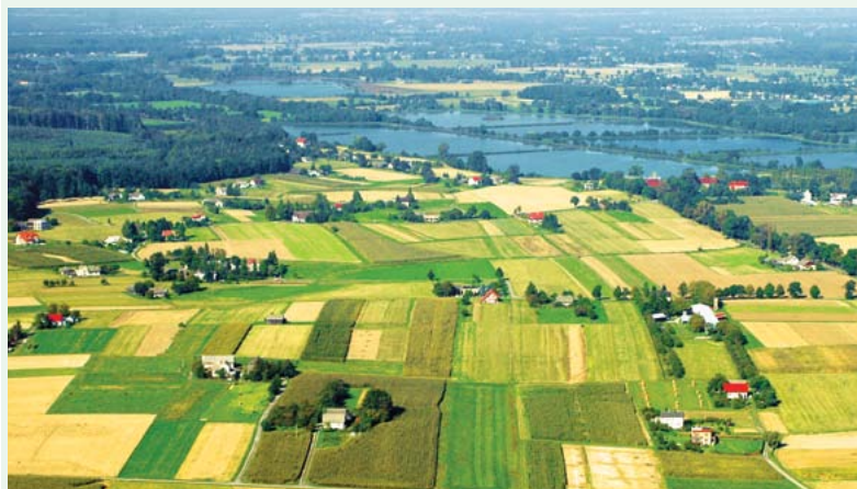
Panorama Dębowca - stawy dębowieckie, fot. J. Szczołka

Trasa Nr 13 Z biegnie z Rybnika, w Jastrzębiu-Zdroju spotykamy się z nią na ul. Korfantego, a dalej ulicami Cicha i Rolniczą oraz Podleśną kierujemy się na Ruptawiec. Następnie ul. Libowiec i Matejki w kierunku ul. Długosza i Skargi kierujemy się w stronę gminy Zebrzydowice. Ulicą Akcyjną dojeżdżamy do doliny Piotrówki, mijając po drodze liczne stawy i Zebrzydowice Dolne. Tu ul. Stawową i Zamkową równoległe z trasą Nr 24 C docieramy do Punktu Odpoczynkowego przy Zamku w Zebrzydowicach Dolnych (tu też kończy się trasa Nr 126 Y). Stąd z kolei ul. Zamkową i ul. A. Janusza, brzegiem stawu Młyńszczok