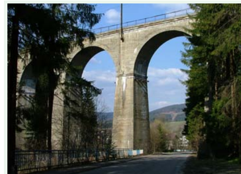
Wiadukt kolejowy w Wiśle

Trasa nr 11 Y: (wycinek 6b) Landek – Pierściec – (wycinek 6a) Skoczów – Simoradz – Dębowiec – Zamarski – Cieszyn