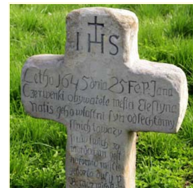
Krzyż pokutny w Pruchnej

Pierwszy dzień wycieczki rozpoczynamy w Jaworzcu - miejscowości sanatoryjno - wypoczynkowej leżącej w dolinie rzeki Jasienicy, u stóp Błatniej i Cubernioka. Spośród wielu znajdujących się tu atrakcji warto zobaczyć zespół pałacowo - parkowy z końca XVIII w., założony przez barona Arnolda Saint - Genois d'Anneaucourt i jego żonę Annę z Nałęcz - Laszowskich. Wokół rozciąga się piękny park w stylu angielskim z końca XVIII w. W jego południowej części stoi kanelowana kolumna z I poł. XIX w. z pamiątkową inskrypcją, w zachodniej natomiast tzw. folwark dolny z XVIII i XIX w. Interesującym obiektem jest również neoklasycystyczny kościół ewangelicko - augsburski z II poł. XVIII w. We wnętrzu świątyni na uwagę zasługuje ołtarz główny z figurami ewangelistów, ambona i obraz przedstawiający Ostatnią Wieczerzę z końca XIX w. Jednak najciekawszy przedmiot w kościele stanowi niewątpliwie dzwon z końca XVIII w., ufundowany przez barona Arnolda Saint - Genois d'Anneaucourt i ozdobiony herbami właścicieli Jaworzca. Powyżej pałacowego parku wznosi się bryła klasycystycznego kościoła rzymskokatolickiego Opatrzności Bożej z początku XIX w. z późnobarokowym tabernakulum, klasycystycznymi ołtarzami bocznymi i organami.