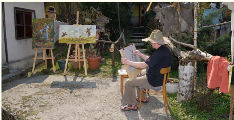
Galeria stracha polnego w Rudzicy