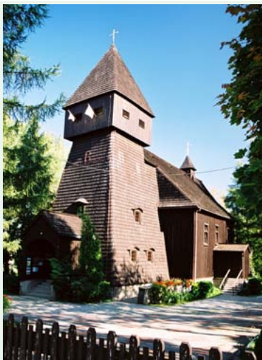
Kościół św. Barbary i Józefa w Jastrzębiu

kiego. Na jego granicy R4 na krótkim odcinku przebiega przez gminę Pawłowice, miejscowość Golasowice. W Zbytkowie Eurovello R4 wraca na teren Euroregionu Śląsk Cieszyński przebiegając ulicami gminy i miasta Strumień i na granicy z Wisłą Małą (powiat pszczyński) opuszcza obszar Śląska Cieszyńskiego. Dalej w kierunku Pszczyny, Oświęcimia i Krakowa trasą R4 opiekuje się Miasto Pszczyna, a od granicy województwa Oddział PTTK w Krakowie.