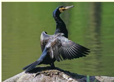
Ptactwo wodne Jeziora Goczałkowickiego w Zarzeczu