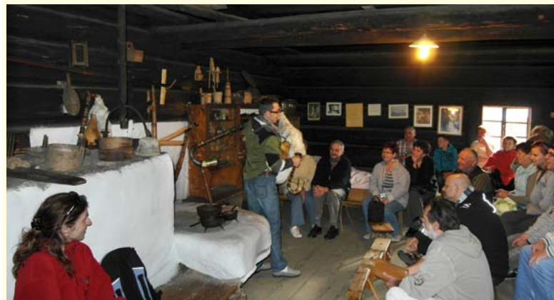
Wnętrze chaty u Kawuloka

Koniaków, Wisłą Ustroń, Górkę Małą, Skoczów, Łączkę, Bładnice Dolne, Golezów, Cisownicę, Dziegielów, Cieszyn, Gumną, Kończyce Małe i zrzesa 27 osób.