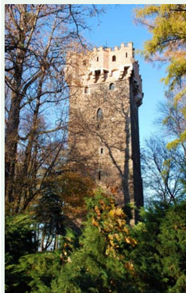
Wieża Piastowska w Cieszynie

się w stronę Strumienia, ulicami Brodeckiego i Łuczkiwicza docieramy do rynku w Strumieniu. Tutaj nasz szlak kończy się, uzyskując połączenie ze szlakiem Nr 9 N do Jastrzębia-Zdroju.